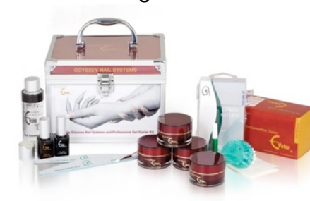
Gel-Kit "New Era"